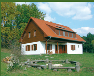
Chata Jagdhütte Bulhary