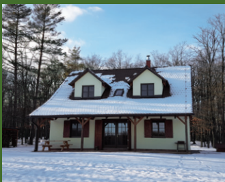
Chata Diana Jagdhütte Diana Moravský Krumlov